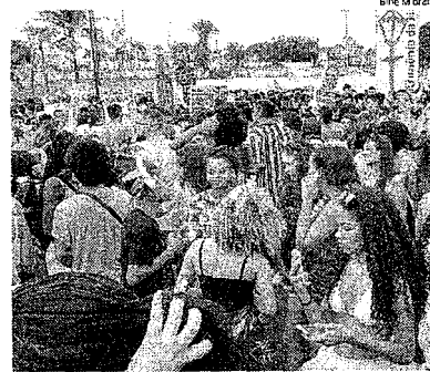
Pré-Carnaval tem registrado muitos furtos e roubos na Beira-Mar

e fevereiro no pré-Carnaval. A Avenida Beira-Mar recebe o circuito do bloco "So Safoados", com percurso entre a Praça Maria Aragão e o entorno do prédio da antiga Refica. O bloco é considerado um dos mais animados do Carnaval nos últimos anos. A Praça dos Cataleiros, na região da train Grande, recebe o "Bloco da Imprensa", que anima a população de São Luis há alguns anos. Outro ponto que recebe grande público é a Fonte do Ribeirão, onde ocorre a concentração organizada pelo "Bloco da Bandeira", que compõe a festividade da capital maranhense há quase duas décadas. A Madre Deus recebe o maior número de foliões